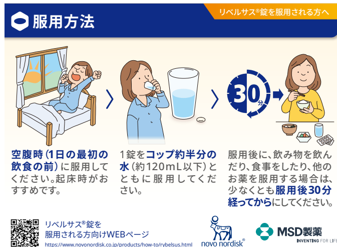
図2:リベルサス®錠の薬袋用リーフ