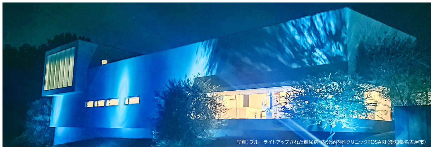
写真:ブルーライトアップされた糖尿病・内分泌内科クリニックTOSAKI(愛知県名古屋市)